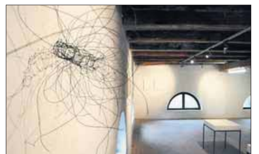
Betörend Zartes von Brigitte Schwacke bei der Jurorenschau im Grundbuchamt.

Vernissage am Samstag, 6. März, um 19.30 Uhr im Grundbuchamt. Geöffnet freitags bis sonntags, 14 bis 18 Uhr, geschlossen am 12., 19. und 26. März.